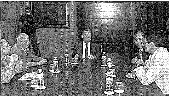
Paulino Rivero con responsables del Grupo Microfusión.

Rivero subrayó en declaraciones a los medios de comunicación que la reunión había sido "interesante" y recordó que Microfusión "coincide" con la apuesta del Gobierno de Canarias por "la nueva economía". Explicó que la empresa